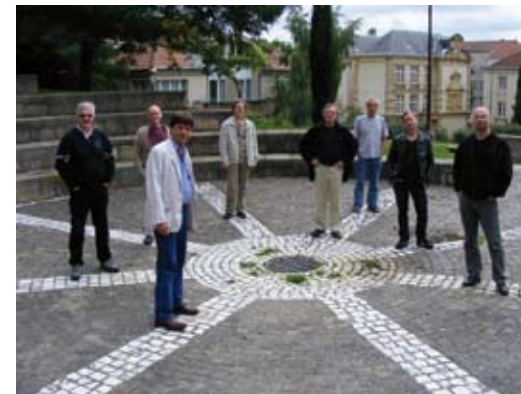
En coréalisation avec la Fabrique – Espace Fayolle, saison culturelle de la Ville de Guéret. Avec le soutien de la Spedidam.